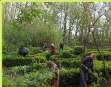
Frühjahrsputz im Schulgarten und auf dem Schulgelände