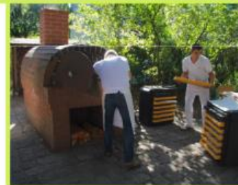
Erhalt und Nutzung des schuleigenen Backofens