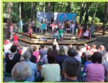
Musical-Aufführung auf der Theaterbühne zum „50 Jahre Waldstadt-Grundschule“-Fest

Auf unserer Webseite können Sie sich über aktuelle Aktivitäten und Projekte informieren.